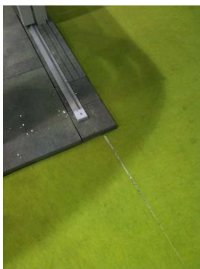
Ex : Fixation sur dalles

Il est demandé aux exposants d'utiliser le matériel adéquat pour fixer leurs structures sans percer le sol des bâtiments (cf. photo ci-dessous)